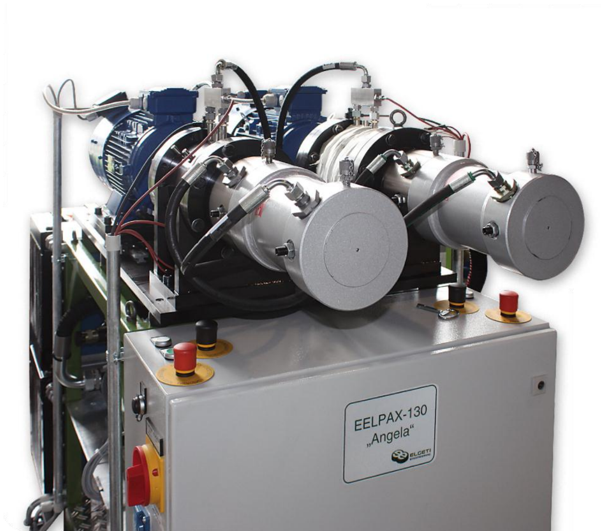
Рисунок 2: EELPAX-130 с нагревом на левой установке, управление с помощью персонального компьютера на отдельной позиции